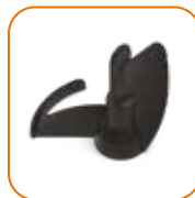
Acessório de mistura