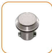
Adaptador de cozedura lenta