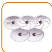
5 discos de corte · corte grosso · corte fino · ralar grosso · ralar fino · ralar extra fino