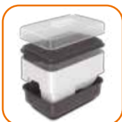
Caixa de armazenagem