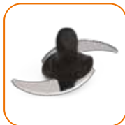
Lâmina de corte