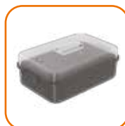
Tabuleiro de vapor 7,2L